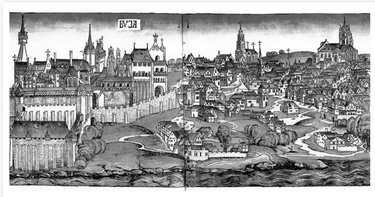
Buda legkorábbi ismert ábrázolása Hartmann Schedel Világkrónikájában (1493)

A korszakunkat felölelő bő évszázadban Magyarország Európa egyik leggazdagabb és legfejlettebb országa volt. Hazánk a nemesfémek kitermelésében az élen járt: a világon fellelhető arany mintegy harmadát a magyarországi bányák adták. Emellett jelentős volt az ezüsbányászat is. Az akkori királyaink által biztosított belső rend kedvezett a földművelés és az állattenyésztés fejlődésének is. A lakosság nagy része mezőgazdasági termeléssel foglalkozott. A parasztok mind több erdőt és mocsaras területet változtattak virágzó termőföldre. Nehézekébe fogott ökrökkel szántottak. A magasabb hegységeken és egyes pusztákon leginkább állattenyésztéssel foglalkoztak. A jobbágyság egyre többet termelt, s így több termést tudtak piacra vinni; kibontakozott a paraszti áruterelés. Fejlődésnek indultak a városok is. Egy-egy városban átlagosan 2-10 ezer ember élt.