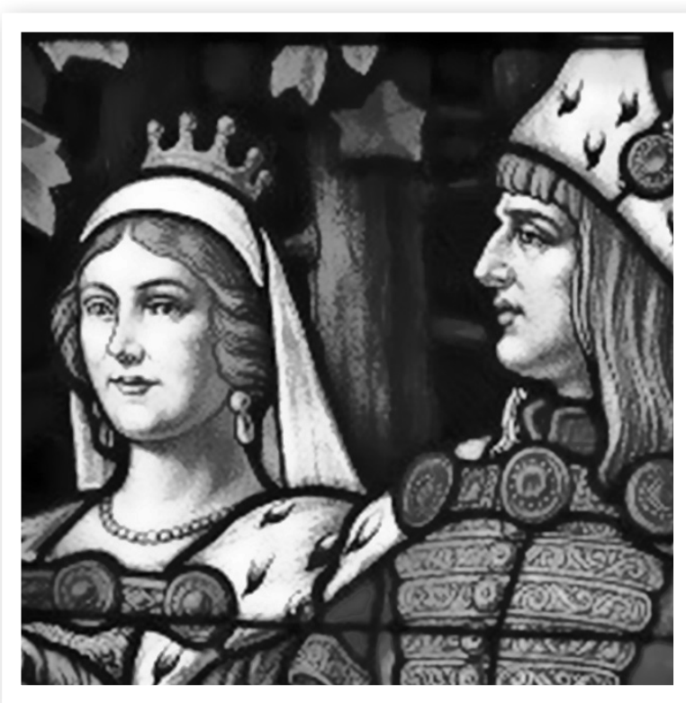
Mátyás király és Beatrix

Mátyás király reneszánsz udvara a lakomákról is nevezetes. Udvari szakácsai túlnyomórészt férfiak voltak, mivel munkájukhoz a vad elejtése, megtisztítása, megnyúzása, feldarabolása is hozzátartozott. A magyar konyha fő jellegzetessége az erős fűszerezés volt, ami az étkek megemésztését is szolgálta. Egy-egy lakoma sok fogásból állt, például Mátyás és Beatrix esküvőjén 24 fogást szolgáltak fel. Hiába ültek az ország előkelőségei asztalnál, mégis sokan összekenték magukat evés közben. A korszakban ugyanis egyetlen evőeszközt használtak, a kést. A menü elmaradhatatlan része volt az édesesség, amit mézzel édesítettek. Az étkek elfogyasztása közben és után az elmaradhatatlan bort cserépedényekben kínálták, és a pohárnokok kötelessége volt gondoskodni arról, hogy a vendégek serlege, kupája ne legyen üres. A középkori Magyarországon már több borvidék is létezett, de a legjobb minőségű nedűt a Duna és a Száva között fekvő Szerémségben termelték.