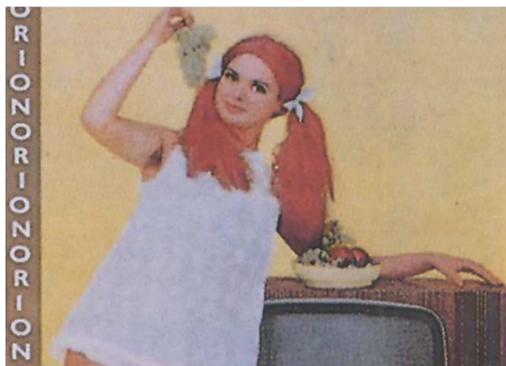
Az 1960-as években egyre több háztartásban volt TV

A Rákosi-korszakban a családok mindennapjait a félelem határozta meg; mivel a letartóztatások leggyakrabban hajnalban történtek, sokakból később is pánikrohamot váltott ki a csengőfrász. A megfélemlítés minden diktatúra jellemzője, ahogy a propaganda is. Nem véletlen, hogy a korszakban fontos szerepet szántak a tömegtájékoztatásnak. Az 1950-es években a Szabad Nép című lapot olvasták a legtöbben.