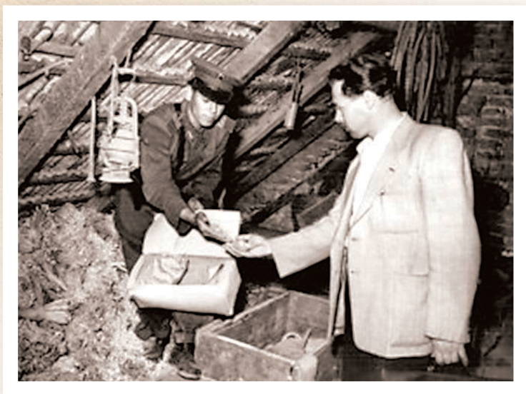
Kutatás egy padláson

Ez volt a korszak egyetlen pártjának, a Magyar Dolgozók Pártjának a hivatalos lapja. A cenzúra nagyon szigorú volt, csak olyan lap és írás jelenhetett meg, amely nem kritizálta a Rákosi-rendszert.